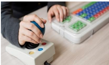
הנגשת טכנולוגיה מסייעת