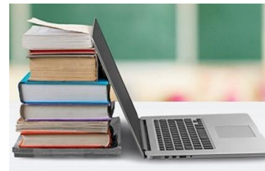
הנגשה בתחום הפדגוגי