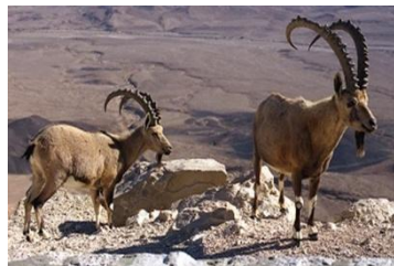
הנגשת טיולים ופעילויות פנים וחוץ מוסדית